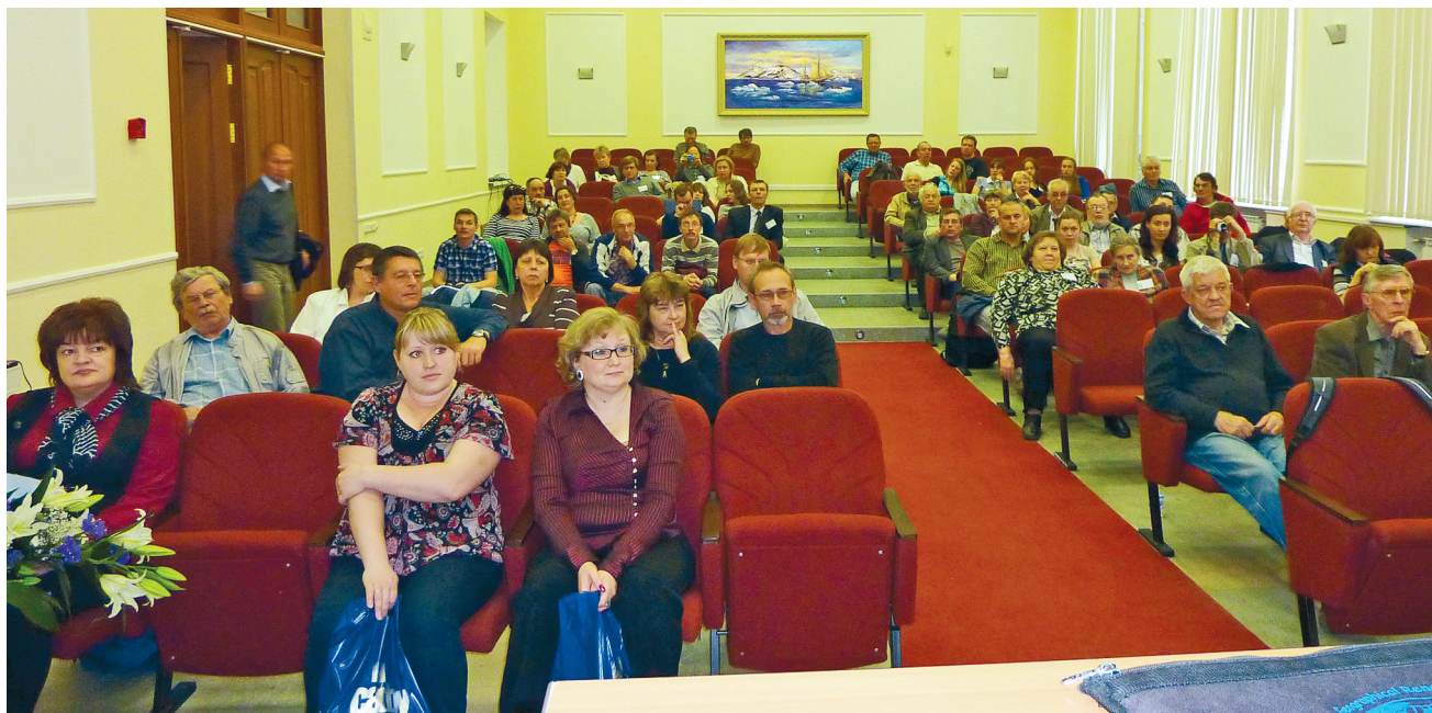
Заключительное заседание симпозиума

На последнем заседании симпозиума состоялась обстоятельная дискуссия, в ходе которой были отмечены главные достижения отечественной гляциологии за последние четыре года: