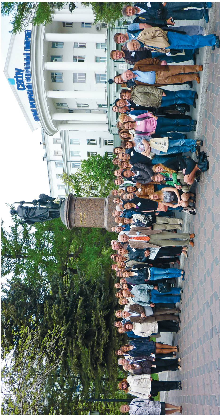
Участники симпозиума у входа в главное здание университета