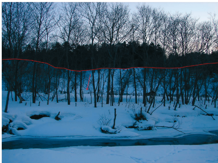
Рис. 4. Речная терраса, высотой 15–20 м, в долине р. Рудановского, сел. Чехов.