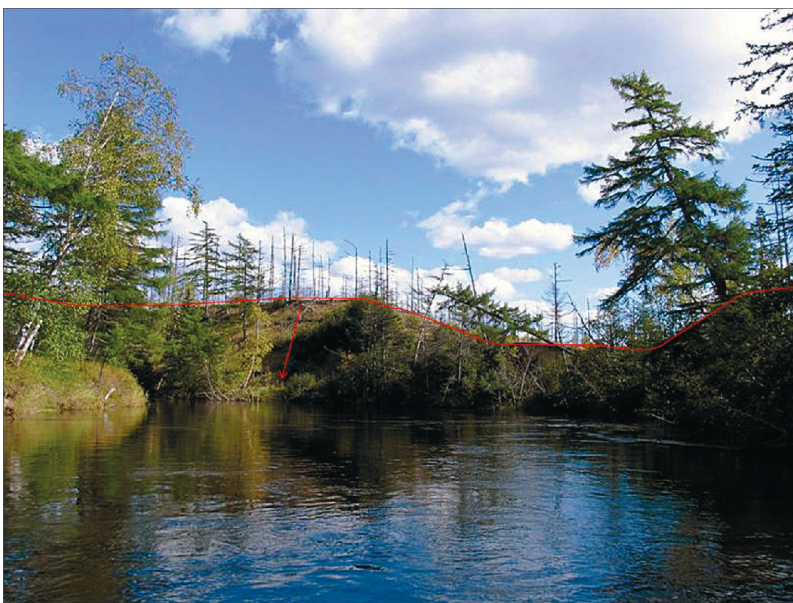
Рис. 2. Северо-Сахалинская равнина. Обрывистый берег в нижнем течении р. Вал (северо-восточное побережье о. Сахалин, морская равнина); высота склона 7 м, уклон 45°.

Fig. 1. River terrace of a height of 27 m, on the which slope as a result of an avalanche 30.12.2007 a man killed, Bykov village.