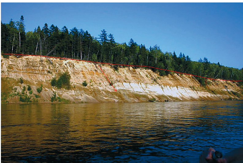
Рис. 3. Обрывистые берега в среднем течении р. Тымь. Тымь-Поронайская низменность.

Fig. 2. The North-Sakhalin lowland. River precipice on the lower course of the Val River (the North-Eastern coast of Sakhalin island, sea lowland); the height of the slope is 7 m, the slope of 45 degrees.