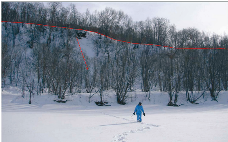
Рис. 1. Речная терраса, высотой 27 м, на склоне которой в сел. Быков в результате схода лавины 30 декабря 2007 г. погиб человек.

Fig. 1. River terrace of a height of 27 m, on the which slope as a result of an avalanche 30.12.2007 a man killed, Bykov village.